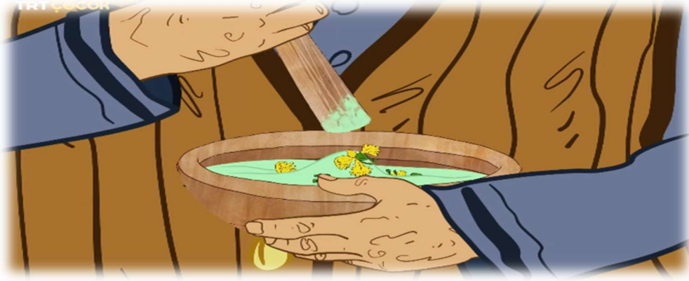
Fotoğraf 7. 91. Bölüm Yaman Dedenin Şira İçin Hazırladığı Şifalı Merhem

süt arttırdığı gibi kan şekerini dengeler ve idrar sökücü özelliği de vardır. 71. bölümde 29 sırtı yaralanan Duman (köpek) için Yaman dede ardıç katranı sürer. “Yörükler için her durumda önemli bir ilaç vazifesi gören çam, katran ve ardıçtan elde edilen püse’dir.” (Ak, 2017a: 396) Şifa kaynağı olan ardıç katranı, ardıç meyvesinden elde edilir, deri hastalıklarına iyi gelir. 91. bölümde 30 sırtı eyerden yaralanan Şira (Maysa’nın atı) için şifalı merhem hazırlar. 98. bölümde 31 ise yediği bitkilerden zehirlenen Zıpir (keçi) için Yaman dede, saparna kökünün kullanmak gerektiğini söyler. Saparna kökü, terletip kanı temizleme özelliğine sahip bir bitkidir. Böylece Zıpir, zehri vücudundan atacaktır.