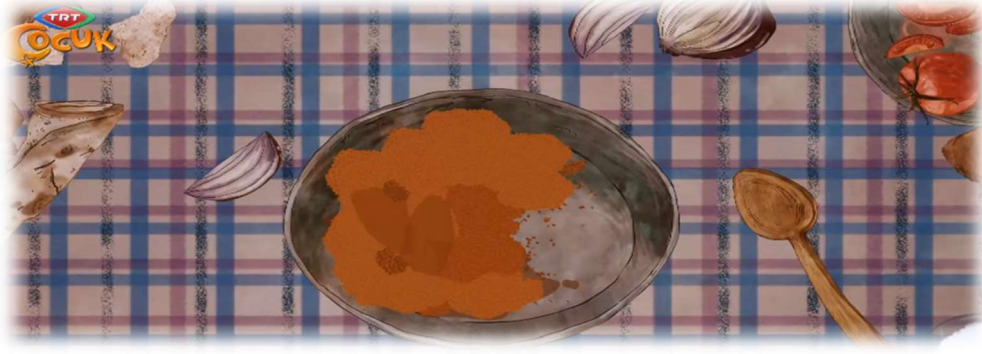
Fotoğraf 10. 20. Bölüm Tahta Kaşık, Bulgur Pilavı, Yufka Ekmeği, Soğan ve Domates ile Birlikte

“Maysa ve Bulut” çizgi filminde aktarılan yemek kültürleri aşağıdaki gibidir;